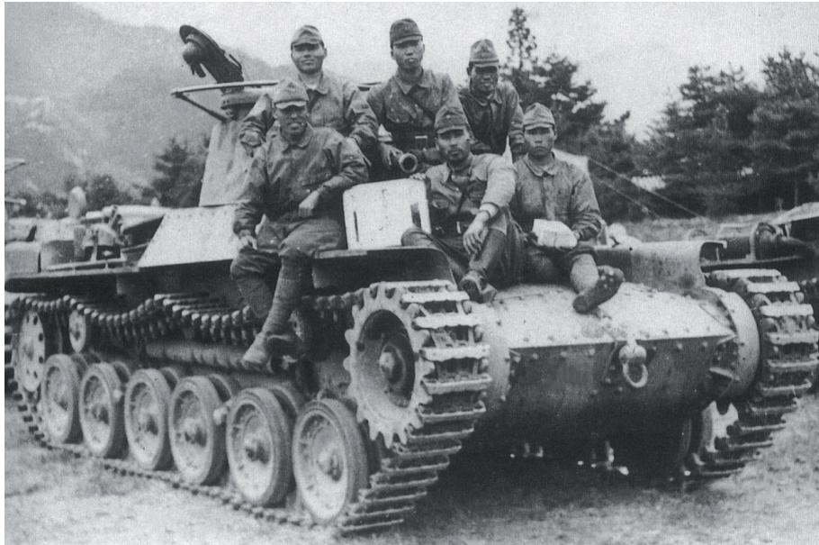
侵占中国华北地区的日军坦克 师士兵

Солдаты танковой дивизии японской армии в оккупированном Северном Китае