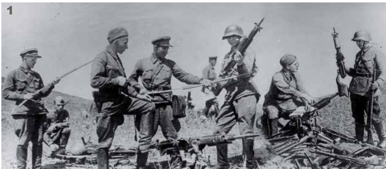
1. 哈拉哈河战役后， 苏军战士收集战利品

1. Сбор трофеев после боев с японскими войсками на реке Халхин-Гол