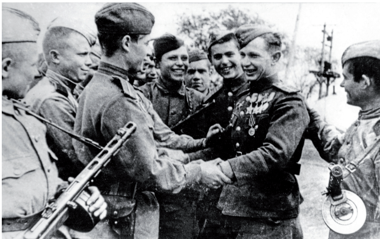
对日作战前夕，击溃法西斯德国后苏联军队从欧洲来到远东地区

Накануне войны с Японией на Дальний Восток СССР прибыли воинские части, принимавшие участие в разгроме фашистской Германии