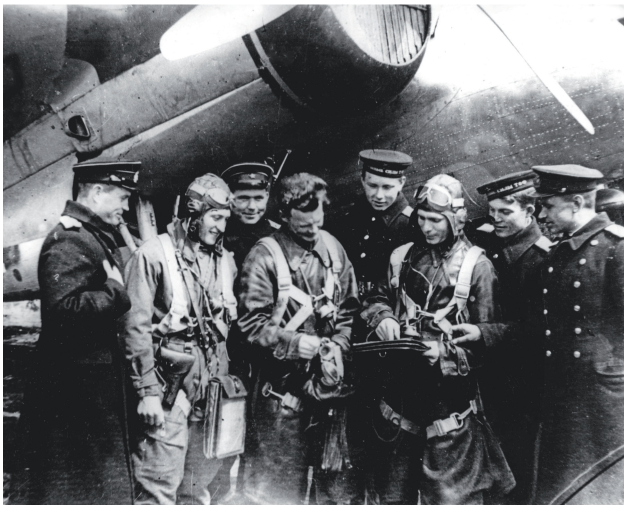
轰炸机飞行员准备战斗飞行

Летчики бомбардировочной авиации готовятся к боевому вылету