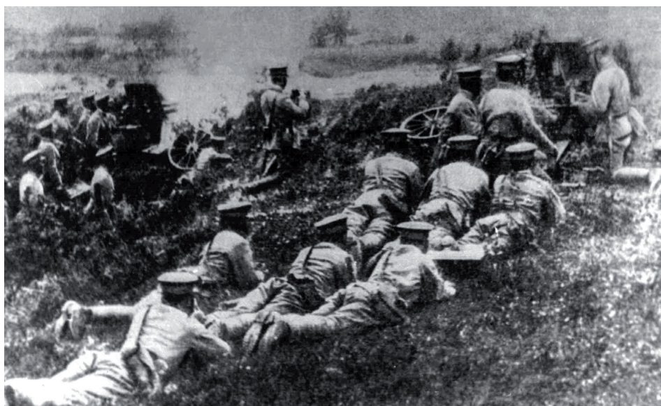
苏俄内战期间，日本炮兵攻击哈巴罗夫斯克

Артиллерия японских оккупантов ведет обстрел Хабаровска в годы Гражданской войны на Дальнем Востоке России