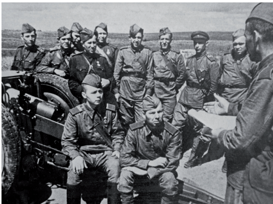
向苏联士兵说明消灭 日本军国主义， 解放中国东北的战斗任务

Летчики бомбардировочной авиации готовятся к боевому вылету