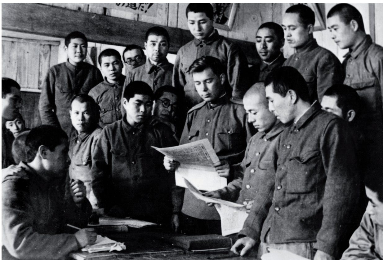
第88独立步兵旅的战士们在政治学习

Политзанятия с воинами 88-й отдельной стрелковой бригады